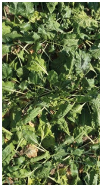
Green on® Zuckerrübe