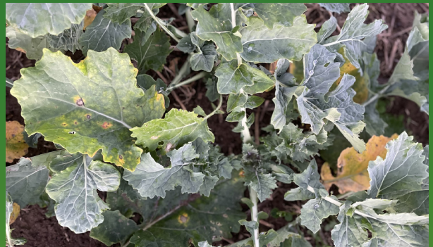
Winterraps mit beginnender Phoma-Infektion